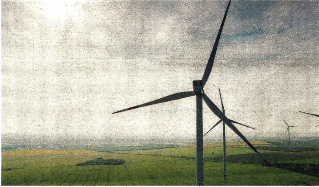
Sostenibilità La transizione verso un modello più green oriented è cominciata