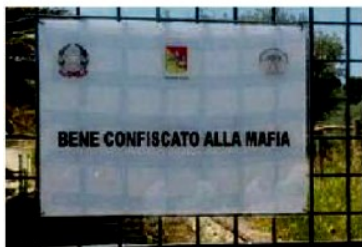
Patrimonio dello Stato Una sfida per legalizzare l'economia

Nel Messinese sono 80 le aziende che sono state confiscate definitivamente alla mafia; 45 sono dei settori "costruzioni" e "commercio". Fanno parte delle 2.796 aziende che in Italia sono patrimonio dello Stato, di queste quasi un terzo (30,6%) sono in Sicilia. Progetto di Unioncamere .