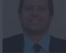
Federico Testa | Presidente Enea.

«Questa collaborazione con un soggetto di particolare rilievo è un risultato importante anche nell'ambito della strategia di Knowledge Exchange lanciata da Enea per rafforzare il trasferimento di tecnologie innovative e servizi avanzati alle imprese. Accordi analoghi sono stati siglati con altri operatori del venture capital con l'obiettivo di accrescere le opportunità di valorizzazione dei risultati della ricerca Enea, in particolare nel campo delle biotecnologie e dei materiali avanzati».