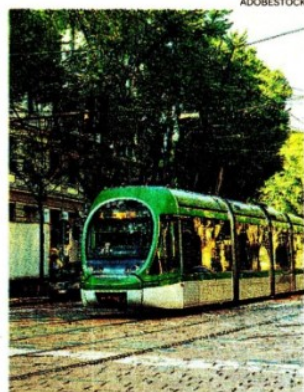
Alberi e mobilità. In centro a Milano