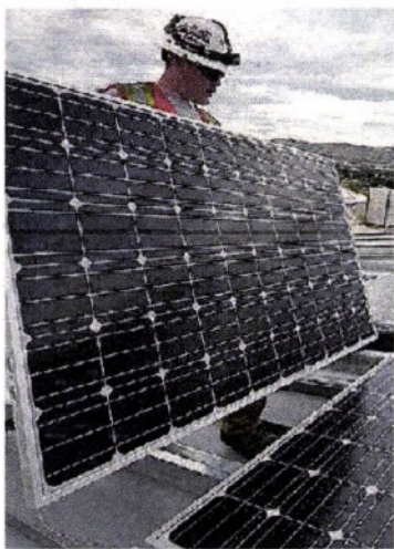
FOTOVOLTAICO Pannelli sui tetti

► Negli ultimi cinque anni le aziende del territorio hanno investito quasi 6 miliardi arrivando all'11° posto nazionale ► Dall'Aglio, presidente di Confartigianato: «Tanti motivi per farlo, ma fondamentali sono i finanziamenti statali»