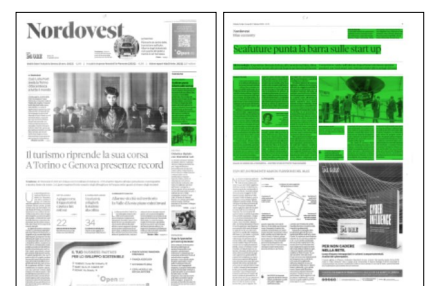
Superficie 41 %

I due bandi di concorso, anche questi con scadenza al 31 marzo, si rivolgono a tematiche estremamente attuali: l'economia blu circolare, i materiali innovativi, l'efficientamento energetico, la transizione ecologica,