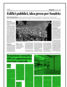
Superficie 30 %