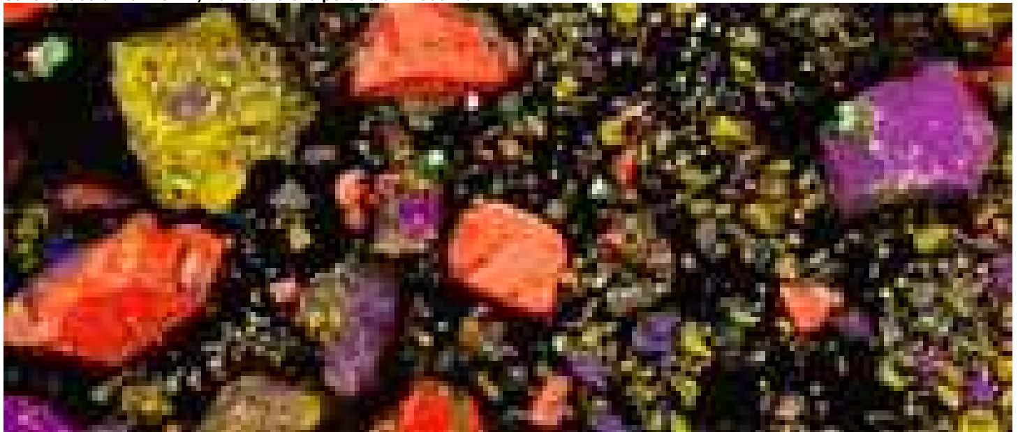
Il rosetto più antico risale a 4.000 anni fa

Tem caldiVareseSanremoSofia GoggiaProtesta trattoriCaso Salls