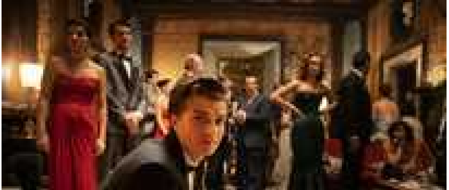
Saverio Costanzo: 'Fellini, Bellissima e la perdita d'innocenza'