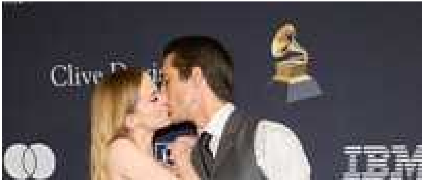
Damiano del Maneskin e Dove Cameron baci sul carpet dei Grammy