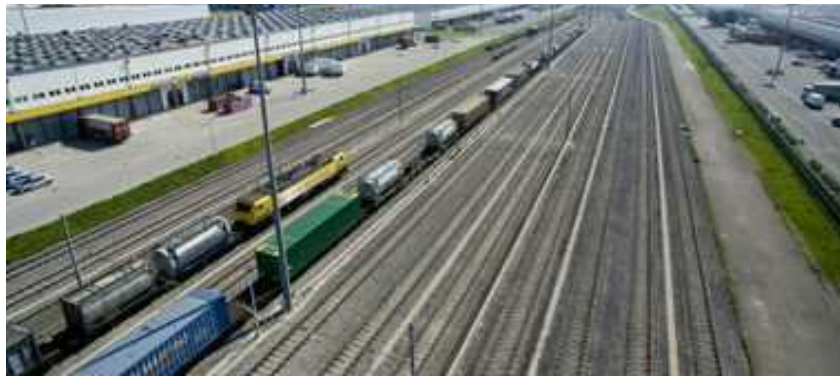
Ma contro il gap delle infrastrutture serve unità tra le otto Regioni del Sud