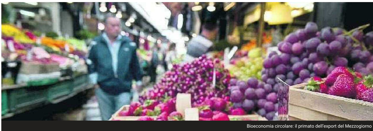
Bioeconomia circolare: il primato dell'export del Mezzogiorno

Le aziende del Sud sono maggiormente votate alla bioeconomia: il 51% del loro fatturato proviene da produzioni di origine biologica