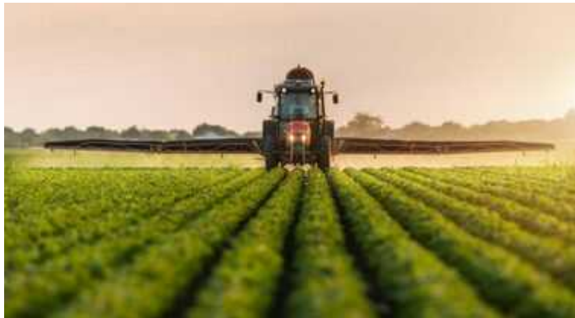
Il "nostro" tesoro agricolo supera il Sud della Spagna