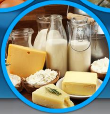
Tabella 1: Indice dei prezzi ufficiali all'ingrosso di Riso e Cereali, Carni, Latte, Formaggi e uova, Oli e grassi