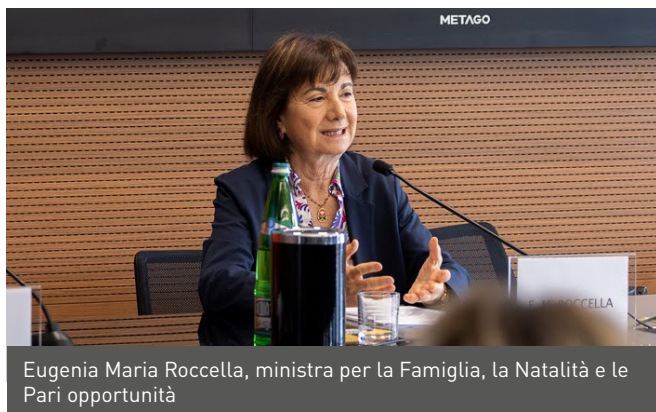
Eugenia Maria Roccella, ministra per la Famiglia, la Natalità e le Pari opportunità

C'è una contraddizione profonda e strutturale che interessa oggi l'Italia e ne blocca la crescita: sebbene le donne rappresentino una componente fondamentale del sistema economico e sociale, il loro contributo resta in larga parte invisibile sottoutilizzato e non pienamente riconosciuto. Parte da questa considerazione il IV Rapporto Italia Generativa , curato dal Centre for the Anthropology of Religion and Generative Studies (ARC) dell'Università Cattolica del Sacro Cuore, promosso da Fondazione Poetica per la Generatività sociale in collaborazione con Unioncamere. La ricerca è stata presentata a Roma il 12 maggio scorso .