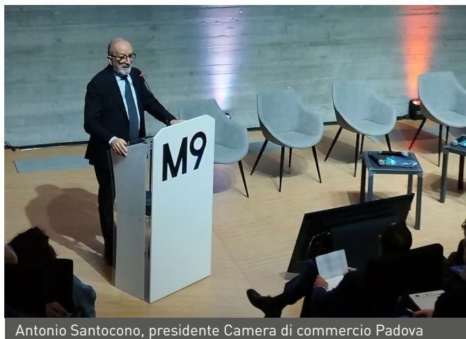
Antonio Santocono, presidente Camera di commercio Padova

La Twin Transition va ben oltre la tecnologia, è una trasformazione strategica e umana per le micro e piccole imprese del Veneto che rende la digitalizzazione e la sostenibilità un'opportunità alla portata di tutti, anche delle realtà più tradizionali. A dimostrarlo sono i risultati del " progetto PID Veneto ", un programma sperimentale di collaborazione e "cross-pollination" che nell'arco di due anni ha coinvolto 175 Pmi venete, tre Università, le cinque Camere di commercio con Unioncamere del Veneto e la Regione in un processo di innovazione condivisa e di sperimentazione concreta. Tra le imprese